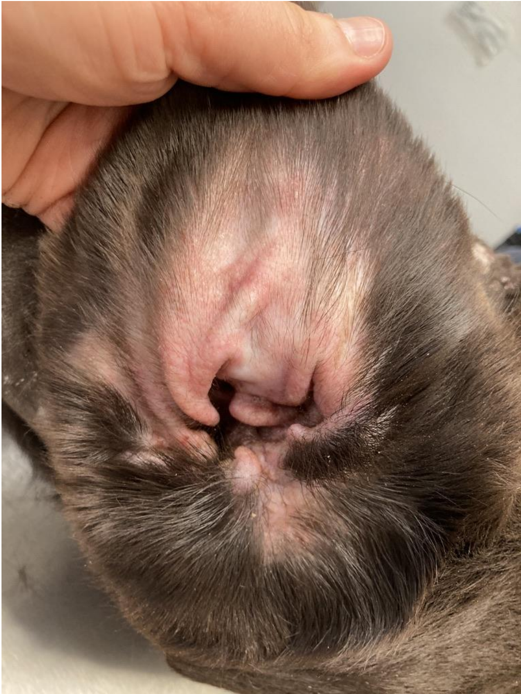
Otite externe chez un chien : érythème sévère et épaissement cutané du pavillon auriculaire et de l'entrée du conduit auditif.